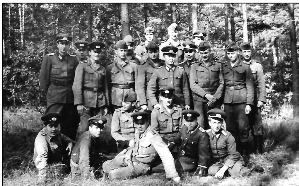
Ein Foto aus der Anfangszeit der FRA-131, hier vor 1965. Die Offiziere tragen an ihrer Uniform noch die dunklen Kragen der Landstreitkräfte. Vielleicht entdeckt W. Bludau darauf noch einige Bekannte. Zur Besatzung der "außerhalb" liegenden Rundblickstation gehörend wird er selbst wohl nicht darauf abgebildet sein.

Vervielfältigung, auch auszugsweise, ist nicht gestattet.