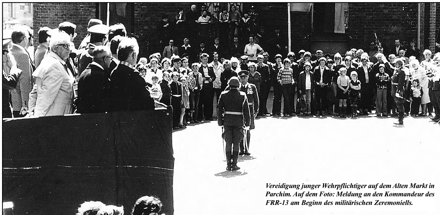
Vereidigung junger Wehrpflichtiger auf dem Alten Markt in Parchim. Auf dem Foto: Meldung an den Kommandeur des FRR-13 am Beginn des militärischen Zeremoniells.