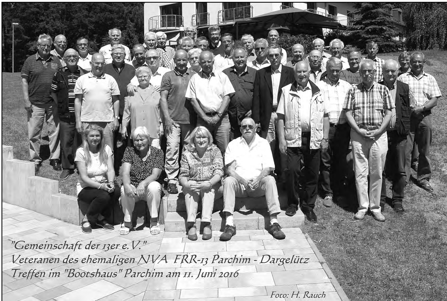
"Gemeinschaft der 13er e.V." Veteranen des ehemaligen NVA FRR-13 Parchim - Dargelütz Treffen im "Bootshaus" Parchim am 11. Juni 2016

Fotos links: Intensive Gespräche während des Treffens.