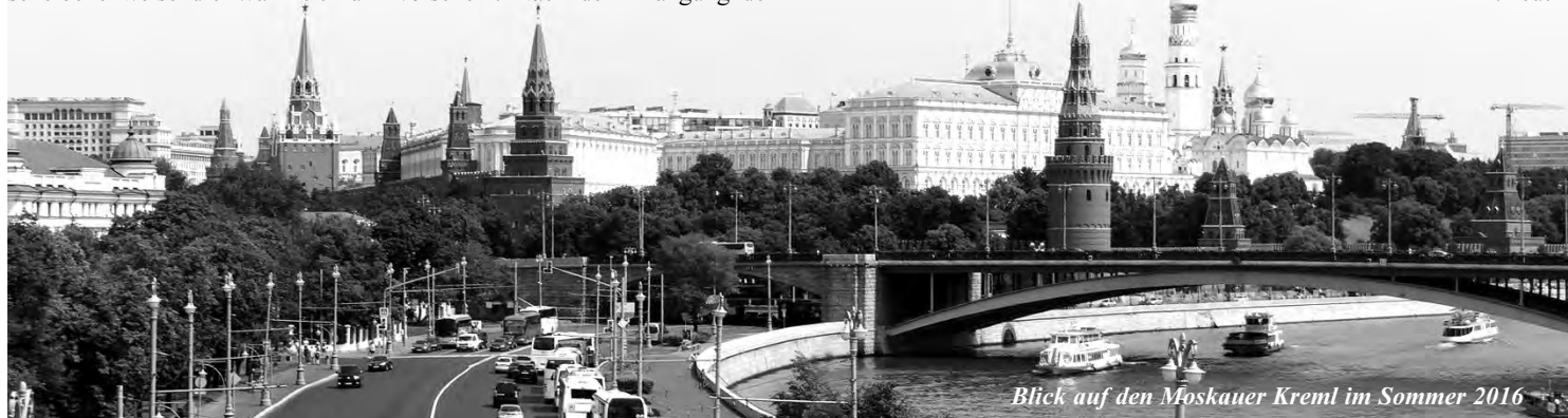
Blick auf den Moskauer Kreml im Sommer 2016

21. Oktober, 18. November, jeweils 19.00 Uhr, im Hotel am Bahnhof (Wackernagel). Am 7. Dezember findet unsere diesjährige Weihnachtsfeier statt. Beginn 18.00 Uhr im Wackernagel. Achtung , der Termin fällt auf einen Mittwoch! Der Vorstand